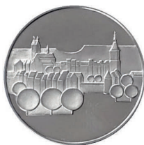
Gedenkmünze ETF 1972