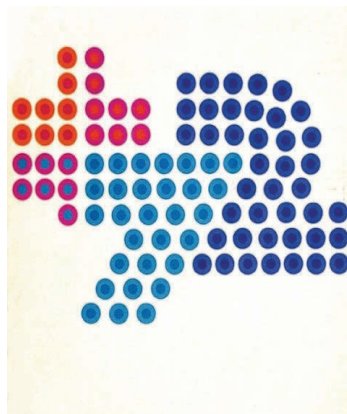
Aarau Schweiz. Frauenturntage 15.-18. Juni Eidgenössisches Turnfest 21.-25. Juni

Erstmals in der Geschichte der Schweizerischen Frauenturntage traten die Turnerinnen wettkampfmässig zu den verschiedenen Disziplinen an. Die Organisatoren erstellten offizielle Ranglisten und ermittelten die jeweiligen Siegerinnen. Den Kritikern aus dem Lager der Männer zum Trotz kam der Schweizerische Frauenturnverband (SFTV) damit dem Wunsch der «jungen Mädchen von heute» nach, sich mit anderen zu messen, Selbstbestätigung zu finden und als Sportlerinnen anerkannt zu werden.