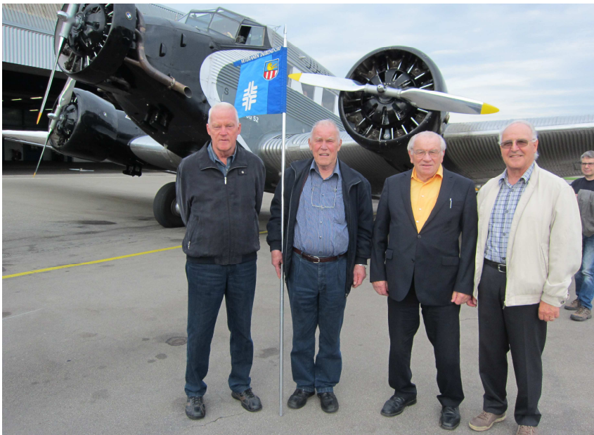
„Happy Landing“: Hermann mit Empfangsdelegation