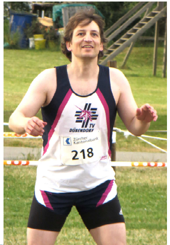
gleich doppelte Erfrischung nach anstrengendem Wettkampf. Na dann: Prost!