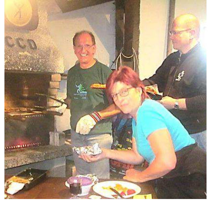
Grill-Kudi at Work